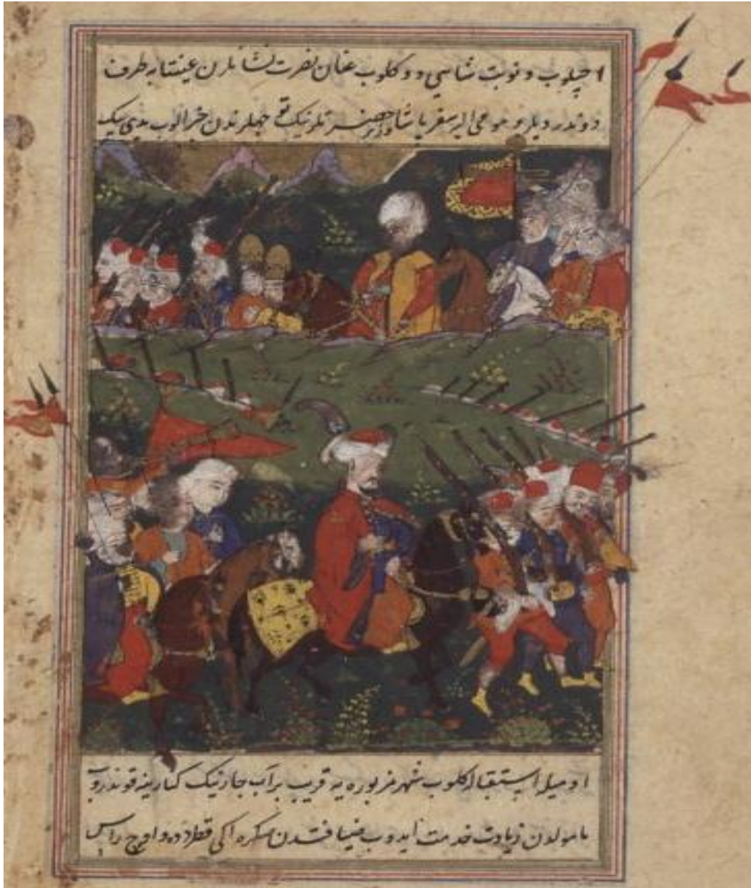
المنمنمة الرابعة (صفحة ٥ ا ب) : يوسف باشا في عينتاب