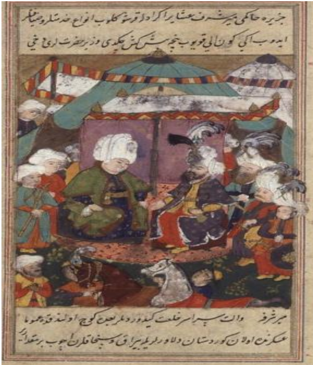
المنمنمة السادسة (صفحة ١٩ ب) : لقاء يوسف باشا مع احد الحكام وزعماء القبائل