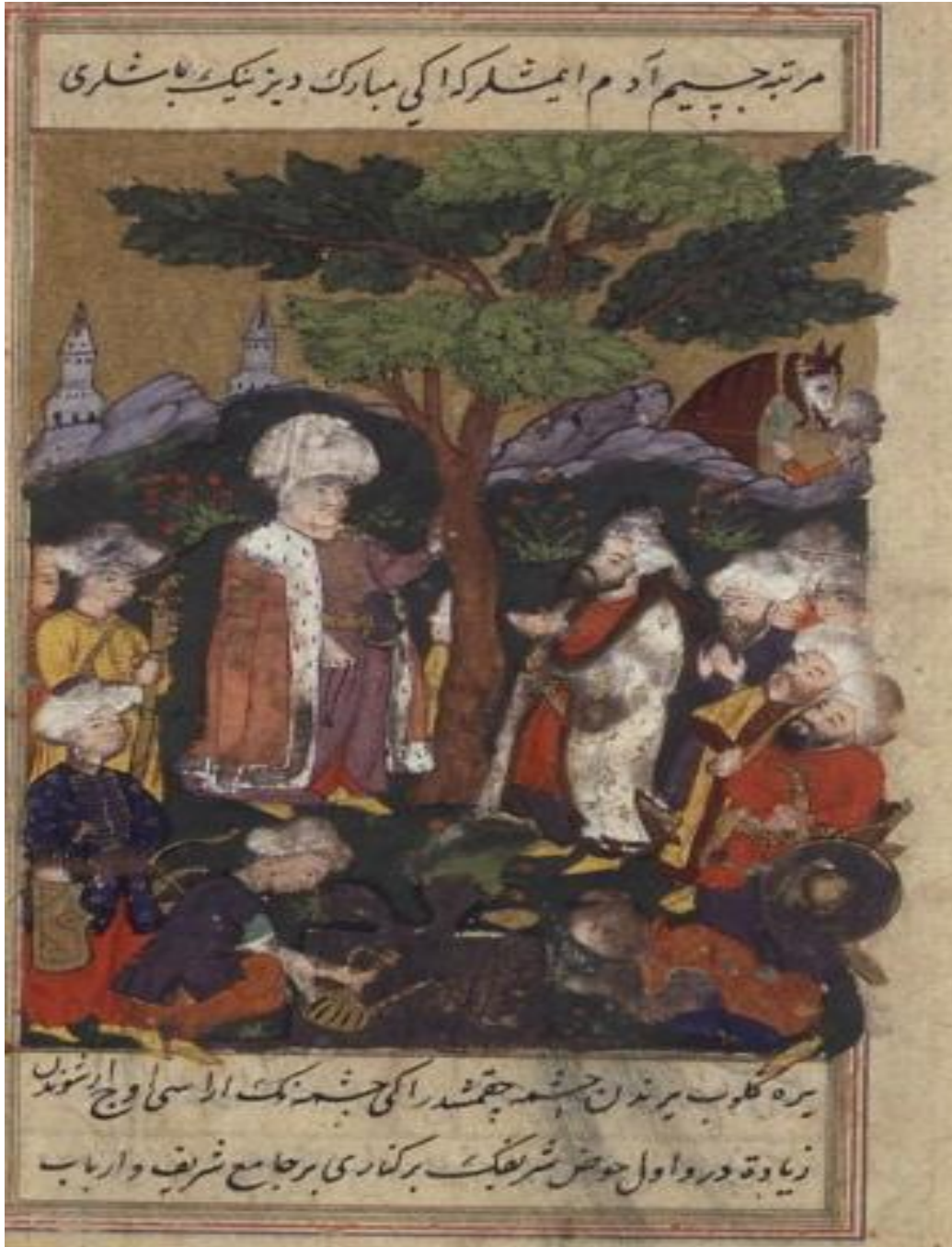
المنمنمة الخامسة (صفحة ١٧ ب) : يوسف باشا عند بركة النبي ابراهيم "ص"