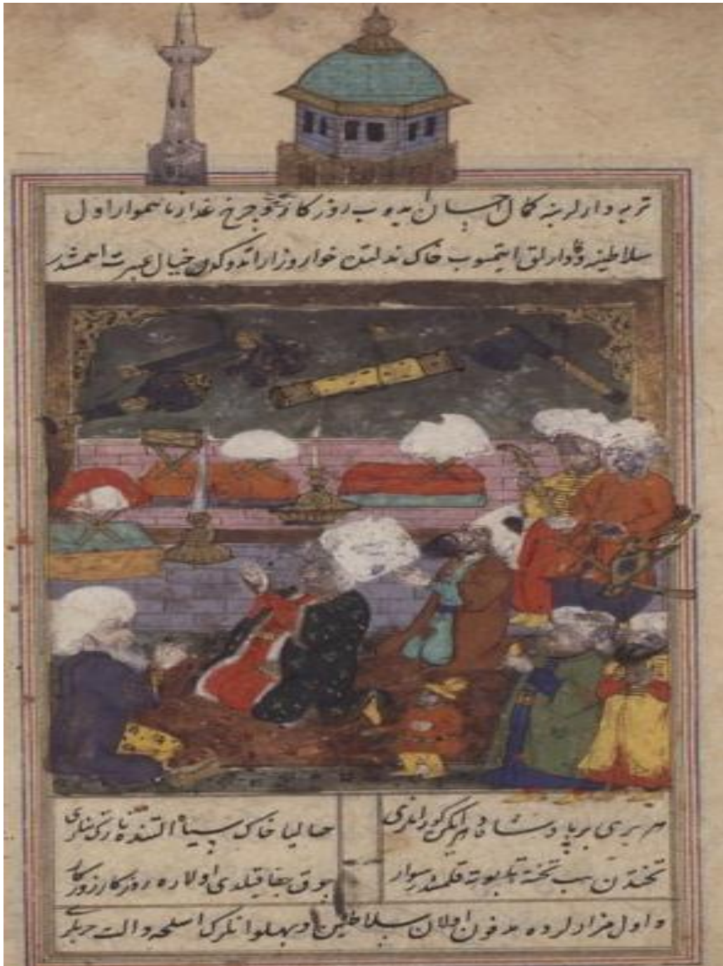
المنممة الثانية ( صفحة ٨ أ ) : زيارة ضريح السلطان علاء الدين