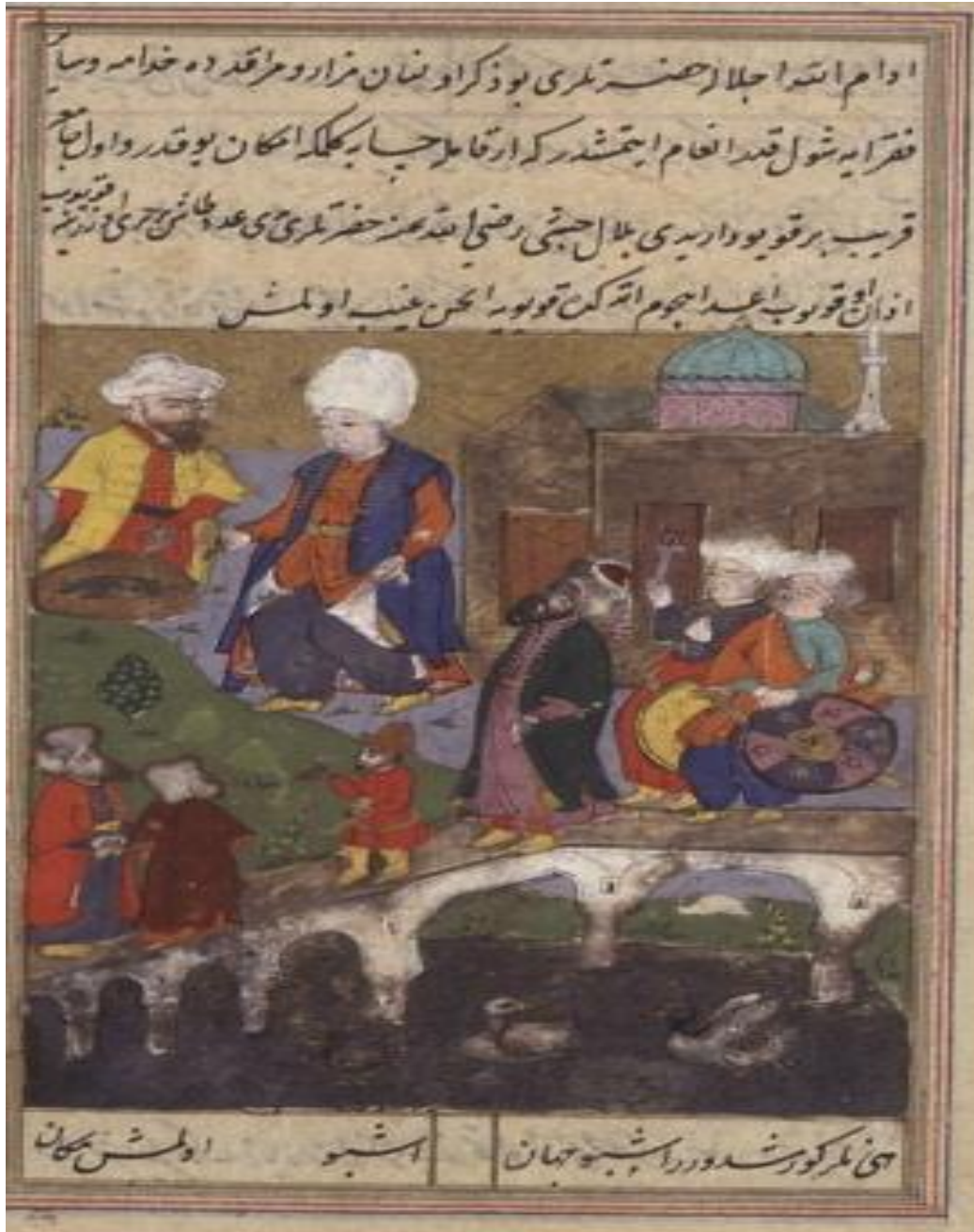
المنمنمة الثالثة (صفحة ١١ ب) : زيارة قبر النبي دانيال "ص"