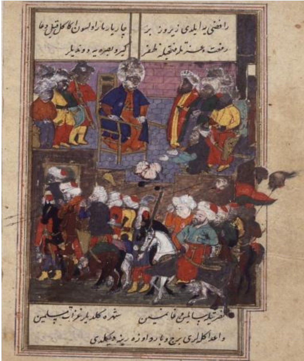
المنمنمة السابعة (صفحة ٢٩ ب) : القضاء على الثوار